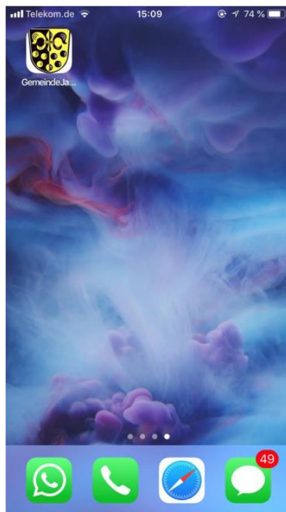
Danach erscheint das Symbol auf dem Handy