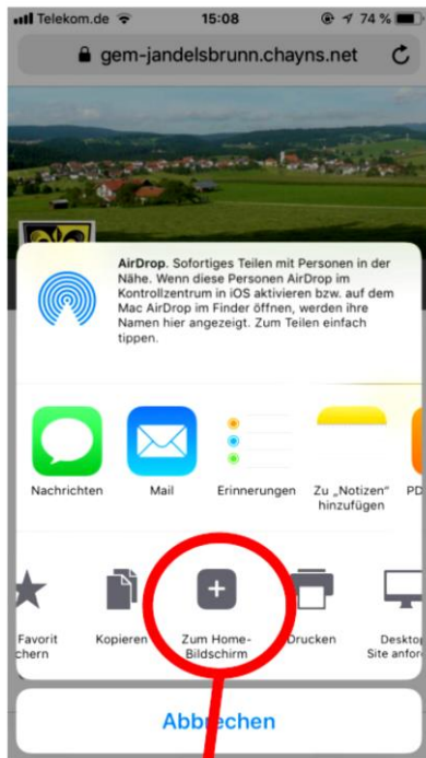
„Zum Home-Bildschirm“-Symbol drücken