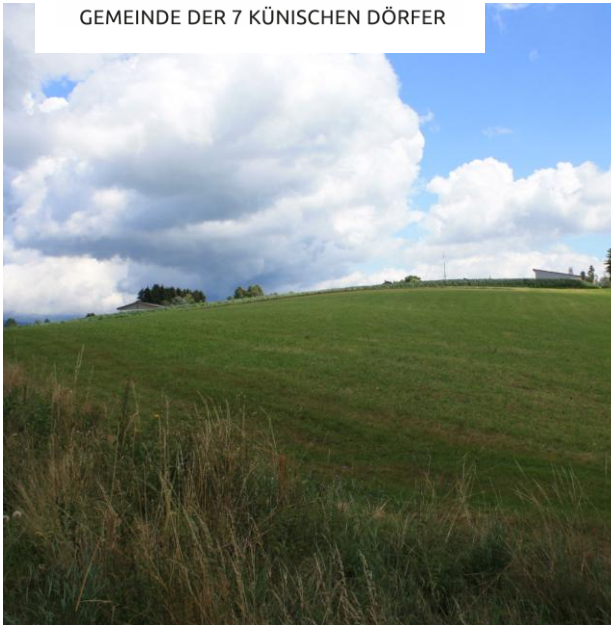
Gewerbegebiet Mösing II nach Osten