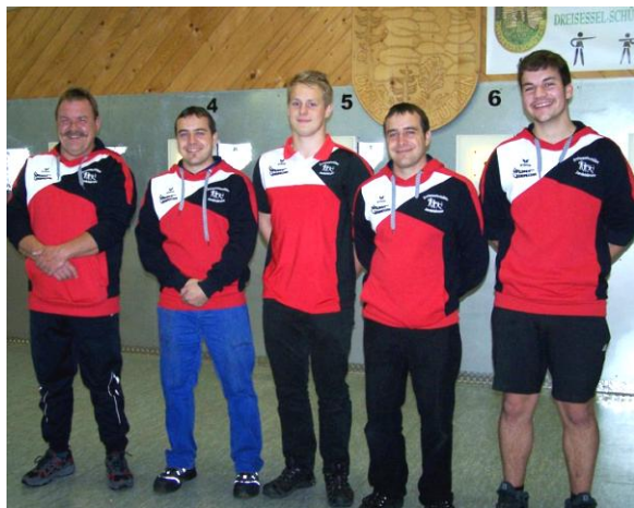
Die Aufstiegs Mannschaft mit den Schützen von links: