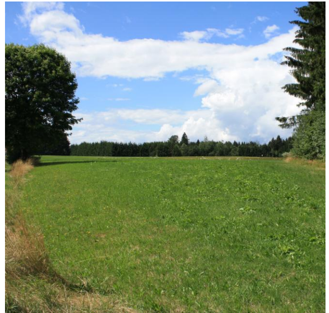
Gewerbegebiet Mösing II nach Westen